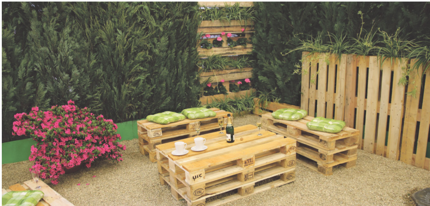
Jardin con pallets

Vivir en un lugar honesto y alineado con nuestros valores es importante