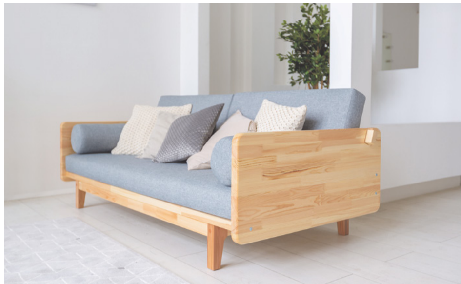
Sofa vegano y ecológico

Quizás nunca te hayas preguntado cómo se producen las velas decorativas. Pues la gran mayoría de las que